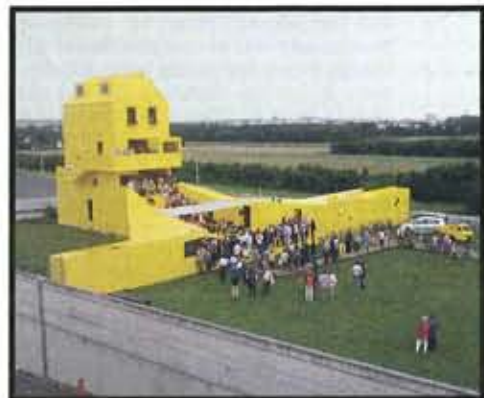
Aus Holz, auf Zeit: das „gelbe Haus“ über der Stadtautobahn.

Was uns anbelangt, so wollen wir nur dem Wunsche des heiligen Vaters und der civilisierten Welt Genüge leisten, indem wir nach Kräften dahin wirken, dem Haupt der allgemeinen Kirche seine Freiheit und seine Unabhängigkeit wiederzugeben, die die katholische Welt nicht gleichgültig zum Besten einer anarchistischen Partei zu Grunde richten sehen kann. ■